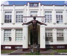
フィリピン大学セブ分校