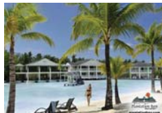
プランテーションベイ