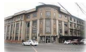
サンカルロス・本校

TOEIC専用カリキュラム化された追加授業を00時間設定(毎週)「追加料金加算15000円(基本1週)会話中心のマンツーマン指導(在宅指導)90分x5日(毎週)(時間選択)「追加料金加算15000円(5日間)」