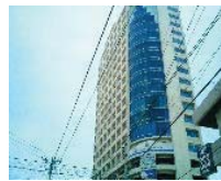
市内コンドミニウム