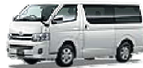
当社バンが通学のお手伝い！

宿泊先は市内ホテル、コンドミニウム(自炊可能)から選択、ご自分のライフスタイルを愉しんで下さい。