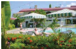
モンテベルロホテル