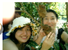
メガネ猿の環境整備

滞在中には、ボランティア活動にも参加可！ "孤児院への慈善訪問" 自然環境への奉仕活 動として"マングローブ植林(ボホール島)そし て、"絶滅危惧種動物、ターシャ(メガネ猿)への 環境整備活動"から選択。感謝状発行