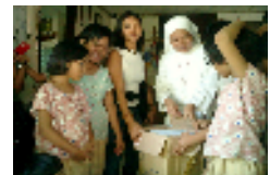
孤児院への奉仕活動