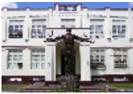
フィリピン大学セブ分校

80時間受講・8時間×10日間 大学キャンパスの独特の雰囲気ある施設内で、 外国人学生との語らいや友情を育むチャンス。 受講証明書発行！