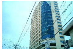
市内コンドミニアム