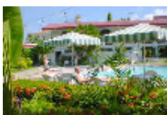
モンテベルロホテ